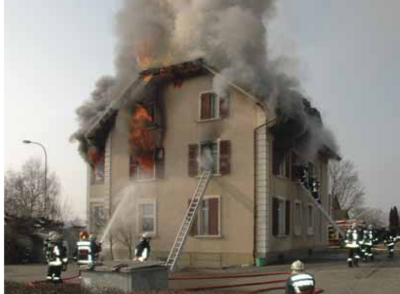
Incendie à Bettlach 2011. L'immeuble était déjà la proie des flammes lorsque les pompiers sont intervenus.

Le feu et la fumée peuvent se propager extrêmement rapidement dans un immeuble. Il est d'autant plus important de miser sur une protection incendie active.